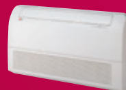
Vloer- / Plafondmodel